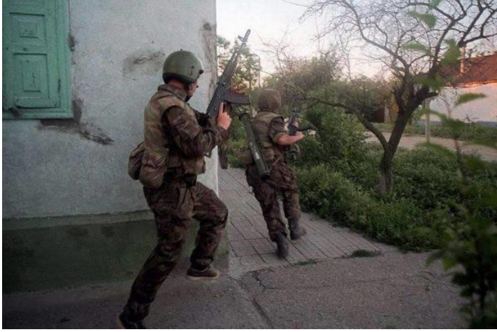
Фото: Штурм больницы в Буденновске