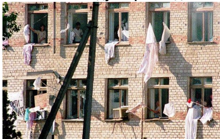
Террористы захватили в заложники более 1200 жителей Будённовска, которых согнали в районную больницу № 2.

Все осторожно, боясь попасть под пули наших солдат, выглянули в окно, обращенное на восточную сторону, и увидели на небе Крест, как бы облачный. Справа от Креста на воздухе стояла в скорбной позе Богородица, обращенная ко Кресту, молящаяся, в черных одеждах. Но люди были в сильном страхе от обстрела и басаевцев, и, естественно, не могли как следует разглядеть явления Богородицы, только думали: