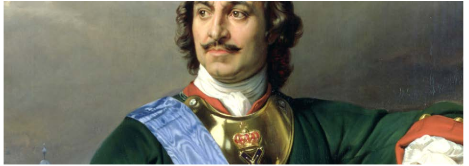
Император Петр I Великий

Они жили долго и счастливо. И умерли в один день. И последние их слова были: "Я тебя люблю!" Каждый из нас хотел бы, чтобы про него так написали после смерти. Но разве про кого-нибудь так написано, кроме как в сказках?..