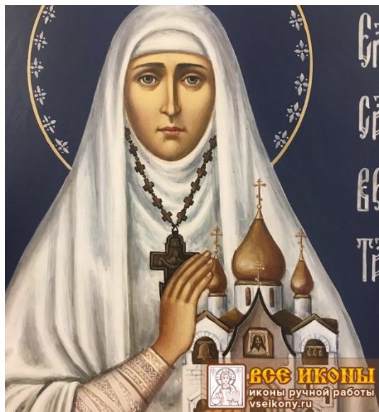
Св.прп.мчн. вел. кн. Елисавета

В русской истории только три государя носят прозвище "Великий". Это Иван III, Пётр I и Екатерина II. Александр III создал в конце XIX века могущественное государство. Мощь России была столь крепка, что за годы его правления никто не осмелился воевать с нами. Ему принадлежат крылатые выражения: "Англия и Франция могут подождать, пока русский государь ловит рыбу" и "У России есть только два союзника в мире — это её армия и военно-морской флот". Он по праву заслужил то же прозвище, что у Ивана, Петра и Екатерины. Умирая, сей исполин на троне исповедовался, причастился , и последними его словами были слова молитвы святого Иоанна Златоустого: "Верую, Господи и исповедую, яко Ты еси воистину Христос, Сын Бога Живаго, пришедый в мир грешныя спасти, от них же первый есмь аз. Еще верую, яко сие есть самое пречистое Тело Твое, и сия есть самая честная Кровь Твоя. Молюсяубо Тебе: помилуй мя, и прости ми прегрешения моя, вольная и невольная, яже словом, яже делом, яже ведением и неведением, и сподобимянеосужденнопричаститися пречистых Твоих Таинств, во оставление грехов, и в жизнь вечную. Аминь". На время, пока он читал молитву, силы вернулись к нему, и думали даже, что он выздоровеет. Но как только он прочёл молитву и причастился, тотчас царь онемел,