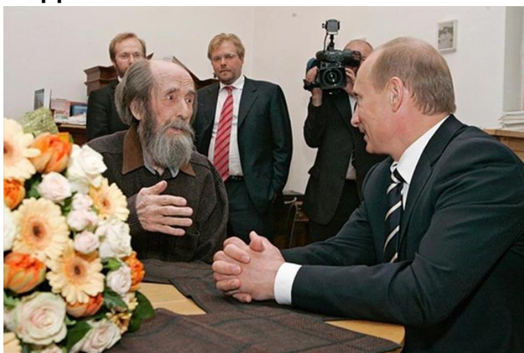
А. И. Солженицин беседует с В. В. Путиным

Творчество Солженицына характеризуется масштабными эпическими сценами. Он обычно знакомит читателя с персонажами, имеющими разные точки зрения на одну проблему, благодаря чему можно самостоятельно делать выводы из того материала, который дает Александр Исаевич. В большинстве книг Александра Солженицына присутствуют реально жившие люди, правда, чаще всего скрытые под вымышленными именами. Еще одной характеристикой работ писателя является его аллюзии на библейский эпос или произведения Гёте и Данте. Очень высоко оценивали