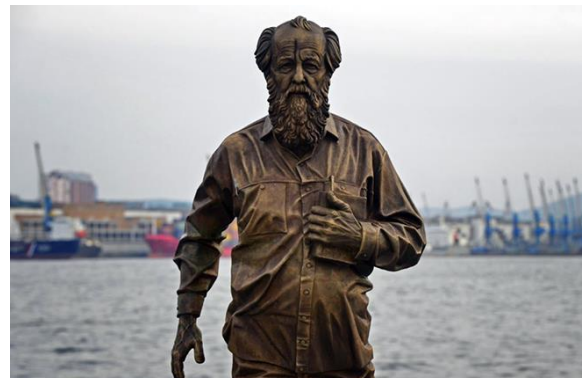
Памятник Солженицыну на Корабельной набережной Владивостока | «Владивосток»

Скончался Александр Солженицын от острой сердечной недостаточности 3 августа 2008 года, не дожив нескольких месяцев до своего 90-летия. Похоронили этого человека, которому выпала неординарная, но невероятно тяжёлая судьба, на Донском кладбище в Москве – самом крупном дворянском некрополе столицы.