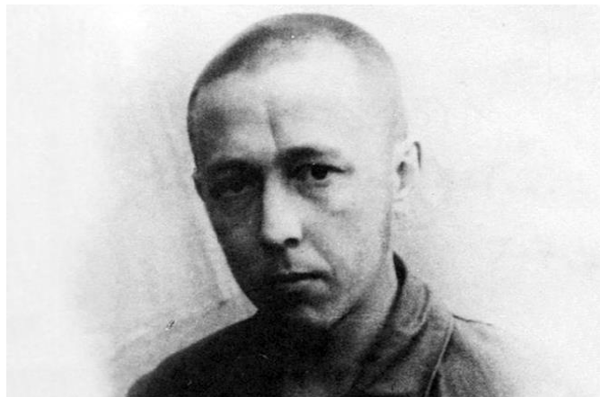
А. Солженицын - в лагере

Усугубила дело невероятная популярность книг Александра Солженицына, которые без его разрешения издали в США и во Франции. Власти видели явную угрозу в общественной деятельности писателя. Ему была предложена эмиграция, а так как Александр Исаевич отказался,