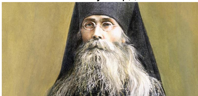
Преподобный Варсонофий Оптинский

– Сокровище мое, дитя мое драгоценное, ребеночек Божий, помоги и спаси тебя Господь! После всего, что Господь открыл мне про тебя, ты захочешь прославлять меня как святого – этого не должно быть, слышишь? Я – человек грешный. Ты никому не скажешь, что я открыл тебе на исповеди, и маме не будешь говорить. А станет мама спрашивать, отчего плакала, скажешь, исповедовал батюшка, говорили по душам, ну о грехах и поплакала. Много-много есть из твоих подруг, гибнущих именно потому, что не говорят на исповеди, а есть одна из твоих знакомых, имени ее не знаю, но есть одна, близка ее гибель, ее нужно спасти. Так ты всех посылай в Оптину помолиться и ко мне направляй: зайдите, мол, к отцу Варсонофию на благословение, а уж мое дело спасать.