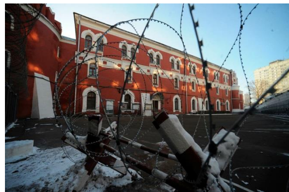
СИЗО – 1 «Бутырка», г.Москва.

Далее – пять лет лагерей, и еще один арест в 1941 году. Затем был выслан на пять лет в Казахстан: сначала в город Актюбинск, а оттуда через три месяца в город Челкар Актюбинской области. В ссылке бедствовал, был тяжело болен. Его спас один незнакомый ему татарин, который отвёз архиепископа в больницу. Когда владыка, выздоровев, встретился со своим спасителем, тот рассказал ему такую историю: «Когда я ехал по своим делам, Бог сказал мне: „Возьми этого старика,