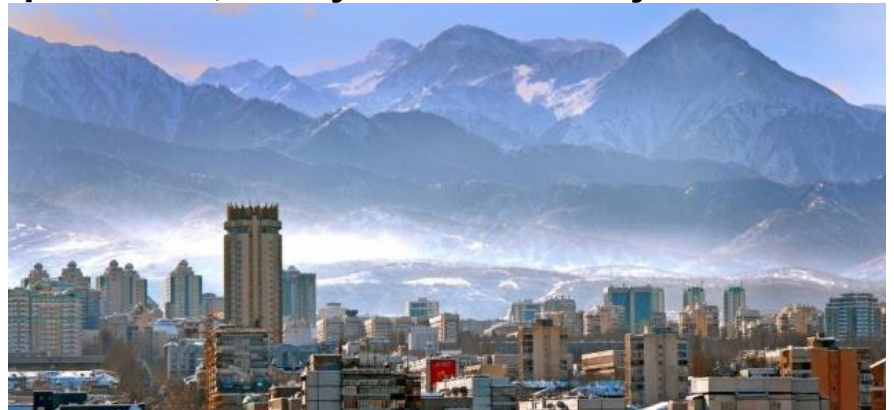
Современный город Алматы

“Господи, – подумала я, – если бы хоть одна капелька попала мне в глаза, ко мне вернулось бы зрение!” Вдруг в этот момент владыка повернулся в мою сторону и окропил мое лицо так, что святая вода