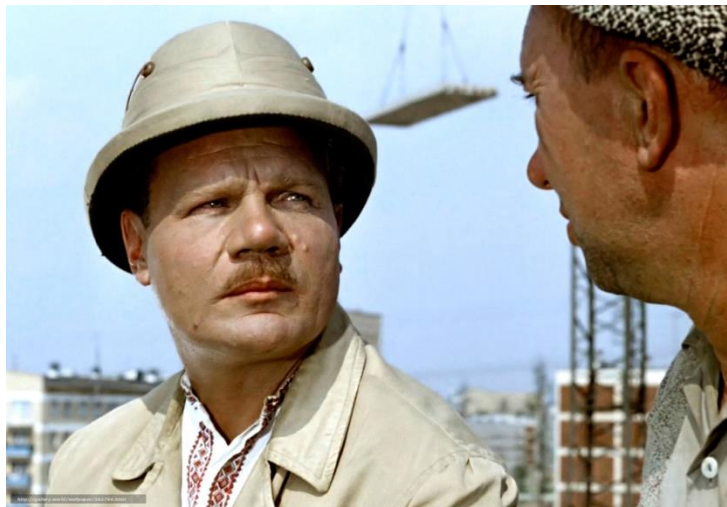
Кадр из фильма «Операция «Ы» и другие приключения Шурика»

Мне это нравилось. На Крестный ход, на Пасху возглавлял шествие. (...) Было очень торжественно и красиво. С батюшкой я стоял на клиросе – мне специально сшили подрясничек. И батюшка мне давал кадило. Я держал, а когда ему было нужно, подавал... К церкви я был приучен».