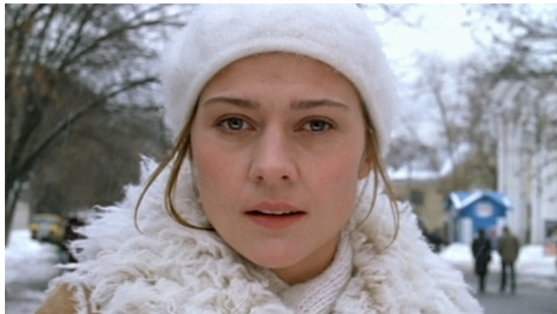
Мария Голубкина. Кадр из фильма «Француз», реж. Вера Сторожева, 2003 г.

теперь?» Когда это произошло, я бегала и всем людям говорила, что это случилось, а они на меня смотрели с ужасом. У них было ощущение, что я сошла с ума. Через полгода я пришла к настоятелю храма сщмч. Антипы на Колымажном дворе протоиерею Димитрию Рощину, и он спрашивает: «Ну что, всё рухнуло?» Я говорю: «Абсолютно всё, но я абсолютно счастлива».