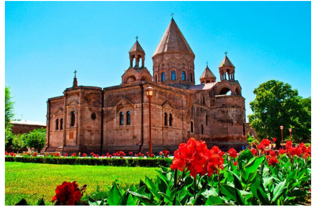
Эчмиадзинский кафедральный собор

Святая Рипсимия вместе со своей игуменией и сестрами бежала в Армению, не желая вступать в брак с императором Диоклитианом (284–305), прельстившимся её красотой. Об этом Диоклитиан сообщил армянскому царю Тиридату и предложил ему или прислать Рипсимию обратно, или же самому взять её в жены. Слуги царя разыскали бежавших и стали уговаривать Рипсимию покориться воле царя. Святая отвечала, что она, как и все сестры обители, обручена небесному жениху и в брак вступать не может. Тогда с неба раздался голос: "Дерзайте и не бойтесь, ибо Я с вами". Посланцы в страхе удалились. Тиридат предал деву на жесточайшие пытки, во время которых её лишили языка, рассекли ей чрево, ослепили и умертвили, разрубив тело её на части. Игумения Гаиания за то, что воодушевляла Рипсимию мужественно терпеть истязания за Христа, вместе с двумя сестрами-инокинями была предана на такие же муки, после чего они были обезглавлены. Остальных 33-х сестер изрубили мечами и бросили тела их на съедение зверям.