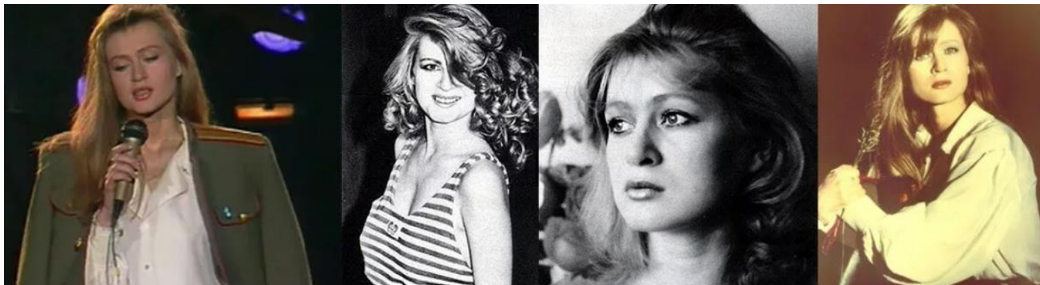
Фото: Творчество певицы хорошо известно старшему поколению