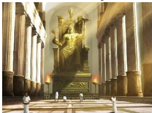
Храм Зевса в Олимпии

https://anygreece.com/pocmotret/istoricheskie-pamyatniki/statuya-zevsa-i-hram-v-olimpii.html