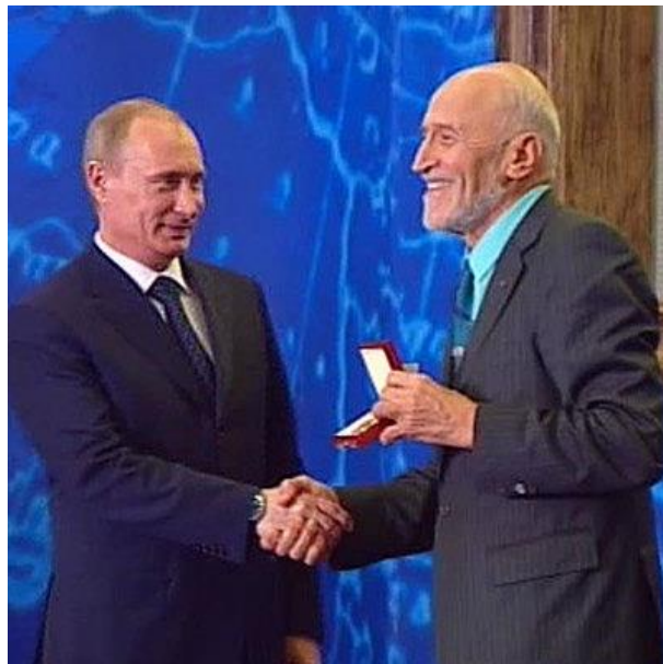
Председатель правительства РФ Владимир Путин вручил памятные медали и дипломы Русского географического общества. Золотой Константиновской медали удостоен известный телеведущий Николай Дроздов.