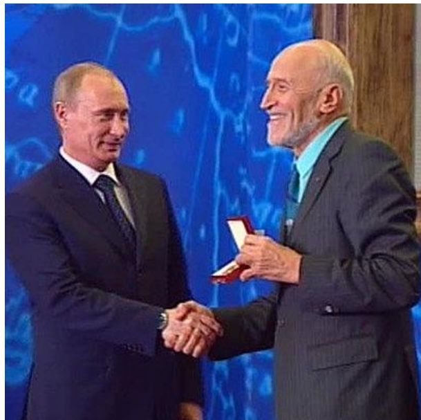
Председатель правительства РФ Владимир Путин вручил памятные медали и дипломы Русского географического общества. Золотой Константиновской медали удостоен известный телеведущий Николай Дроздов.

- Ну, хотя бы такая история. Снимали мы в Индии крокодилов для фильма «Рикки-Тикки-Тави». Подошли к озеру в зоопарке. Крокодилы, как и полагается, лежат в воде. Режиссёр Згуриди говорит: «Нет, эта поза не интересна. Надо чтобы они к нам выползали». Смотритель дал мне для приманки крокодилов целую связку дохлых крыс. Кинул я им одну – крокодилы мигом оживились. Проглотили её, замерли в ожидании следующих. Когда у меня не осталось ни одной крысы, трёхметровый крокодил кровожадно уставился на ногу оператора и стал к ней подбираться. Мне ничего не оставалось делать, как ударить его палкой, и он сразу отступил. Потом я долго переживал, так как считаю, что животных бить нельзя, разве что в крайнем случае. Наверное, это и был