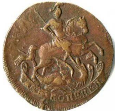
Слово «копейка» произошло от названия «копье». С 16 века на Руси на денежных единицах изображался св. Георгий Победоносец.

вопрос императора, какая же сила помогает мученику, святой Георгий отвечал: «Не думай, что не вредят мне муки благодаря человеческому усилию, – я спасаюсь только призыванием Христа и Его силою. Верующий в Него ни во что вменяет мучения и способен сотворить дела, которые сотворил Христос» (Ин. 14:12). Диоклитиан спросил, каковы же дела Христовы. – «Слепых просвещать, прокаженных очищать, подавать хромым хождение, глухим – слух, изгонять бесов, воскрешать умерших». Зная, что еще никогда ни волхование, ни ведомые ему боги не могли воскресить мертвого, император, чтобы посрамить упование святого, велел ему на его глазах воскресить умершего. На это святой сказал: «Ты искушаешь меня, но ради спасения народа, который увидит дело Христово, Бог мой сотворит это знамение».