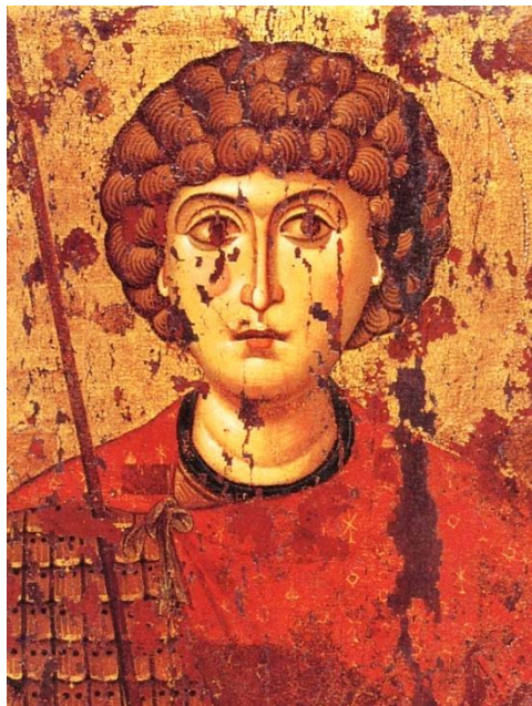
Икона св. вмч. Георгия Победоносца.

другой день на допросе, обессиленный, но твердый духом, святой Георгий вновь отвечал императору: «Скорее ты изнеможешь, мучая меня, нежели я, мучимый тобою».