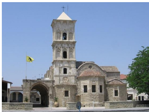
Церковь святого Лазаря в Ларнаке, построенная на его могиле. Кипр

Во время Своей земной жизни Христос сотворил чудо воскрешения из мертвых трижды. Сначала Он воскресил сына наинской вдовицы, которого уже несли хоронить. Второе чудо воскрешения было совершено Господом над двенадцатилетней дочерью Иаира. И наконец, третье – чудо воскрешения из мертвых Лазаря четверодневного.