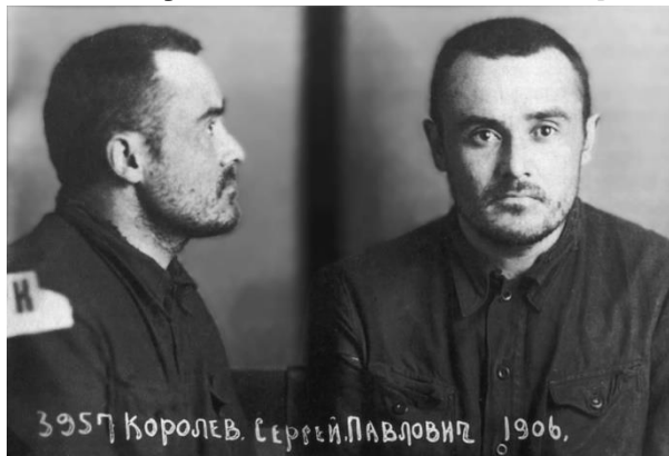
Сергей Королёв в конце своего заключения, февраль 1940-го.

Освобождён Сергей Павлович был в 1944 году. Реабилитирован «за отсутствием состава преступления» 18 апреля 1957 года.