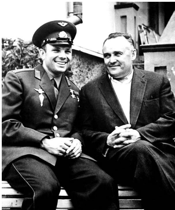
Сергей Павлович Королёв и Юрий Гагарин.

Фото: https://pikabu.ru/story/za_chno_byil_arestovan_konstruktor_serгей_korolev_kazhetsya_opyat_vse_zabyili_4932832