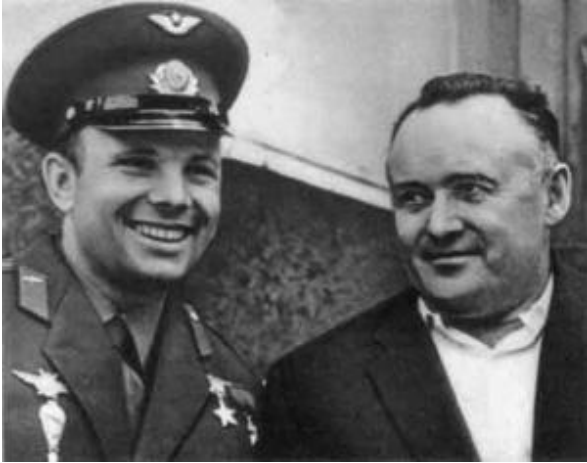
Генеральный конструктор ракетной техники С.П. Королев и первый космонавт Юрий Гагарин.

— Я уже давно никуда не выезжал: в последнее время занимаюсь написанием книги воспоминаний. Жизнь у меня была не «выпил водки –