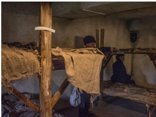
Карлаг. Музей памяти жертв политических репрессий. Мужская камера

постное, а если давали что-то мясное – отвозил заключённым. Позднее вспоминал: «В заключении я был – а посты не нарушал. Если дадут баланду какую-нибудь с кусочком мяса, я это не ел, менял на лишнюю пайку хлеба».