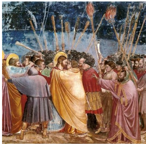
«Поцелуй Иуды», Джотто

Тем временем среди деревьев и кустов послышался шум – это пришли солдаты, чтобы арестовать Спасителя. Открывать свое предательство перед другими апостолами Иуда, видимо, не хотел. Он планировал поцеловать Христа, тем самым указав воинам, кого именно им нужно брать,