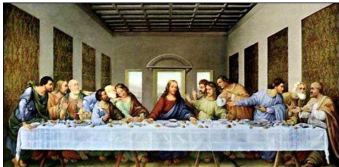
«Тайная вечеря», Леонардо да Винчи

Ученика-предателя охватило чувство вины, которое росло с каждой минутой. В конечном итоге это привело к самоубийству. Иуда повесился, но, согласно преданию, только с третьего раза – две первые попытки были неудачными. Церковная традиция видит в этих «осечках» стремление Бога остановить апостола, обратить его предательство на покаяние – так же, как это случилось позже с Петром во дворе дома, где проходило судилище над Христом. Пётр ведь тоже отрёкся тогда – но покаялся. Иуда, к сожалению, – нет.