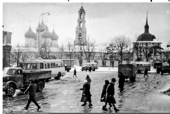
Троице-Сергиева Лавра, 1960-е годы.