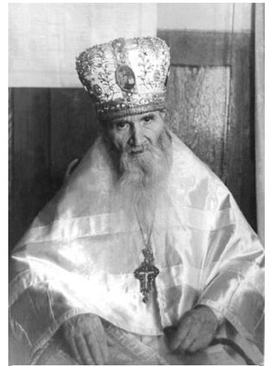
Преподобноисповедник Севастьян Карагандинский