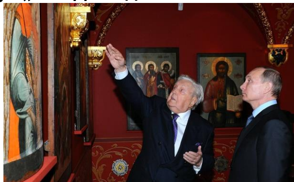
И. Глазунов - с президентом России В. Путиным в Музее сословий России, 2.06.2015 года

Ещё больше интересных статей см. на сайте: https://небесный-дом.рф