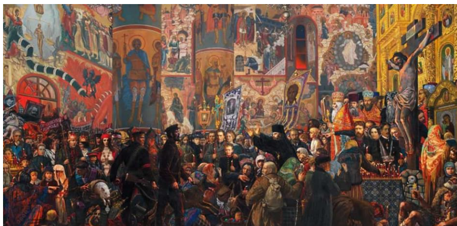
«Разгром храма в Пасхальную ночь», И.Глазунов 1999 г.