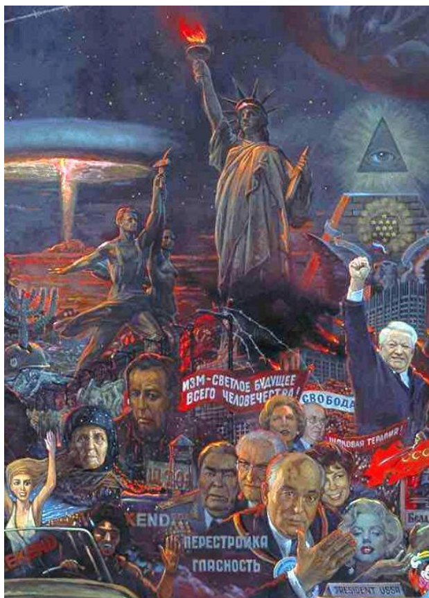
Фрагмент полотна «Мистерия XX века». ( А.Солженицын, М.Тэтчер, Л.Брежнев, Ю. Андропов, М.Горбачев, Р.Горбачева, М.Монро, Б.Ельцин). Автор: И.С.Глазунов.

— Так у вас и родственники были за границей, такие как Питер Устинов, вы же могли не возвращаться.