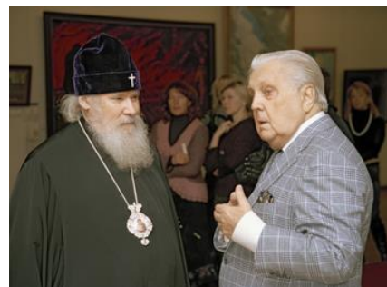
Илья Глазунов и Патриарх Алексий II. Илья Глазунов был одним из главных сторонников восстановления храма Христа Спасителя.

Я вспомнил картину Сандро Боттичелли «Примавера» — «Весна». Змею нарисовал. Он посмотрел: «Молоток. Слушай, если кто тебя тронет, ты нам