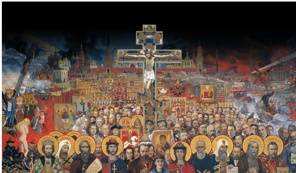
«Вечная Россия», И.Глазунов, 1988 г.

Видите, как я отвечаю на ваш вопрос, что я не путешествовал, а ездил только, куда меня посылали. Я нигде не оставался подолгу. Знаете, почему? Потому что я чувствовал, что умру от страшной и мучительной болезни, которая называется ностальгия. Она ранее уже лишила работы моего