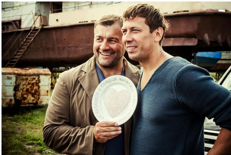
Андрей Мерзликин и Михаил Пореченков – на съёмках фильма "Сердце ангела"

всё сразу исполняется». Я бегом - туда на службу. После службы - молебен, записочки написал. И на следующий день - звонок. Мне говорят: «Андрей, предлагается такая роль». Я даже не мог поверить. В одно касание, в течение одного дня у меня всё решилось. И партнер – Маша Миронова. И режиссер потрясающий, и фильм получился, который изменил мою жизнь, совершил большой поворот в моей карьере. И в фильмографии и в отношении ко мне, как к актеру-человеку. Это фильм «Качели» А на сегодняшний момент я руководствуюсь через батюшку. Я ему даю читать сценарий, обсуждаем то, что я уже сделал.