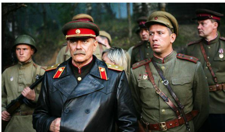
Никита Михалков, Андрей Мерзликин в фильме «Утомленные солнцем-2: Цитадель» (2011 г.)

Я провел, практически, целое лето в институте, смотрел, как люди поступают, сам пробовал поступить, у меня не получилось. Но, тем не менее, я подружился и с педагогами и со студентами, с выпускниками и с поступающими абитуриентами. Я вернулся на свой экономический факультет и рассказал декану о своем прошедшем лете. Он мне говорит: «Я - арбатский парень. Хотел поступить в театральный и не поступил. И жалею до сих пор. Если, - говорит, - тебе пришла в голову эта мысль, ты лучше попробуй. Если не твоё, оно само отвалится». И он меня благословил, конечно, говоря словами громкими, но, тем не менее, благословил. Подтолкнул, сказав, попробуй. Так оно и произошло. И я пошёл во ВГИК и параллельно заканчивал дневной факультет экономического. Два курса, конечно, было тяжело, потому что было по две сессии зимой, по две сессии - летом.