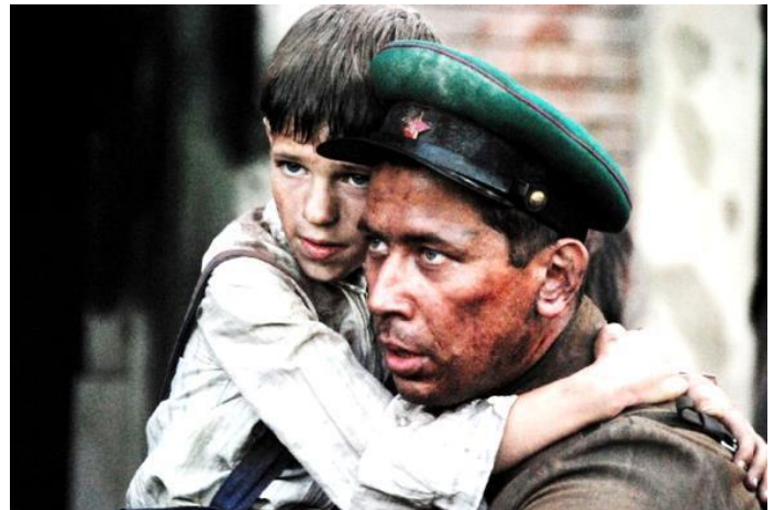
А. Мерзликин - в фильме «Брестская крепость»

- Я заканчивал ВГИК. До этого получил технико-космическое образование, потом - высшее экономическое. Учился я сначала в городе Королеве (раньше он назывался Калининградом). Там, где - «Энергия», где, в принципе, и происходят строительство кораблей, там же - центр управления полетом. Поступил я в специальный техникум космического машиностроения. Закончил его и стал молодым специалистом. Потом в 1992-м году космос официально «вывели за скобки», не было такой индустрии. Заводы стали выпускать скороварки и кухонные комбайны.