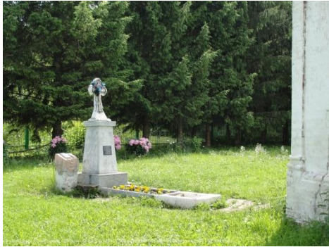
Могила праведного Алексия Бортсурманского