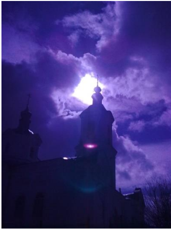
Успенская церковь в Бортсурманах

Оглянувшись, священник увидел, что мальчик сидел в гробу, оглядываясь по сторонам... Как увидел священник, что мальчик сидит в гробу, так он опять упал на колени пред престолом и, тихо плача, стал благодарить Господа. Затем с помощью диакона поднялся и, опираясь на его руку, вышел из алтаря. Что творилось в эту минуту в церкви, передать трудно. Женщины тянулись с плачем к мальчику, чтобы завязать ему глаза. А он даже не отбивался и, молча глядел на них. Только к одной наклонился и сказал тихо: «Не надо...»