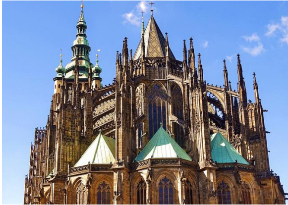
Собор Святого Вита – шедевр готической архитектуры и символ Праги, столицы Чехии.

Имя: https://mitravalny.com/ru/blog/sobor-sv-vita/