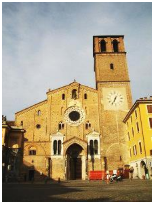
Собор в г. Лоди (Италия), где хранятся мощи свт. Вассиана

По прошествии довольно продолжительного времени святому Вассиану снова пришлось отправиться в Медиолан по церковным делам. Входя в город, он увидел на площади весовщика, который на весах вешал различные товары. Этот весовщик был неправеден, многих обманывал и этим старался доставить себе прибыль. Святой увидел на весах беса, в образе маленького эфиопа, перетягивавшего весы, чем и пользовался неправедный весовщик. Святой спросил бывших с ним: «Видите ли вы что-нибудь странное?» Они ответили ему, что ничего особенного не видят. Тогда святой помолился о том, чтобы и прочим для достоверного свидетельства отверзлись очи видеть тоже, что видел он. И действительно отверзлись духовные очи у пресвитера Климента и у диакона Елвония.