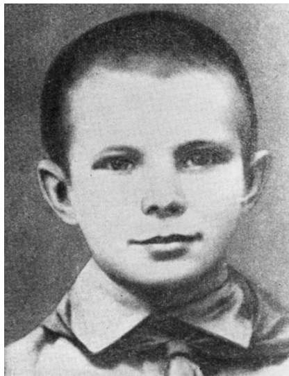
Юрий Гагарин в школьные (1940-е) годы.