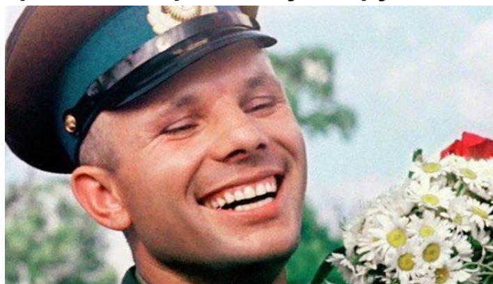
Знаменитая улыбка Гагарина

Годы послеполетной славы также отмечены рядом любопытных эпизодов. Один из них связан с визитом к английской королеве в июле того самого 1961 года. Дело в том, что неизбалованный жизнью советский летчик растерялся. Не от изобилия кушаний, а от изобилия приборов — ложечек, вилочек и специальных щипчиков, обращению с которыми его никто не учил. По свидетельству дипломатов, Гагарин проявил гражданское мужество и прямо сказал: «Ваше Величество! Я человек простой, вырос в глухой русской деревне, где для любой еды инструмент один — ложка. Поэтому я не знаю, как пользоваться всеми этими штуками».