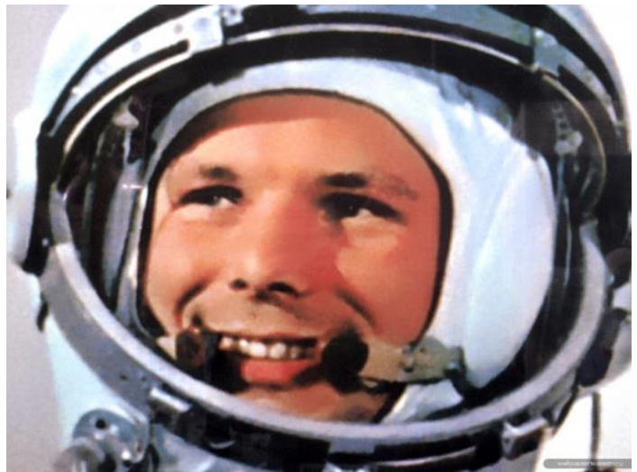
Летчик-космонавт СССР, Герой Советского Союза Юрий Гагарин.

А между тем жизнь первого космонавта была действительно богатой событиями.