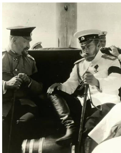
Евгений Боткин и император Николай II

В 1904 году началась русско-японская война. Евгений Сергеевич, оставив жену и четверых маленьких детей (старшему было в то время десять лет, младшему – четыре года), добровольцем отправился на Дальний Восток. Он был вправе не ходить на войну – никто не осудил бы его за это – но, будучи человеком, горячо любящим Россию, доктор Боткин не мог оставаться в стороне, когда речь шла о чести и безопасности Родины. Он стал заведующим медицинской частью Российского общества Красного Креста. Но, несмотря на высокую должность, большую часть времени