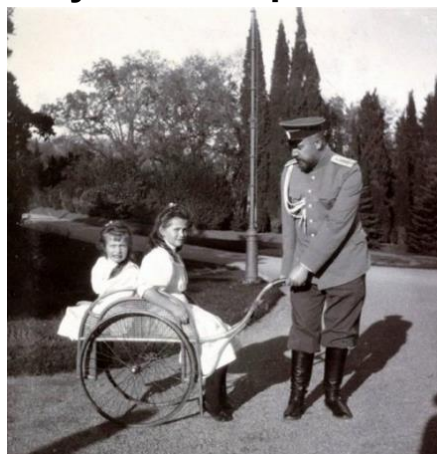
Великие княжны Мария и Анастасия, и Евгений Сергеевич Боткин

В 1910 году от Боткина ушла жена, и с тех пор он целиком посвятил себя царской семье, к которой привязался всей душой. Когда в 1917 году дети государя один за другим заболели корью, доктор вместе с Александрой Федоровной сутками не отходил от их постелей. А потом проявил ещё один свой талант: стал заниматься с цесаревичем русской литературой и сумел очаровать Алёшу лирикой Лермонтова. Обоим эти занятия доставляли невероятное удовольствие.