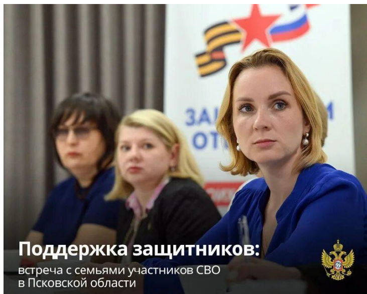
Мария Львова-Белова – на встрече с семьями участников СВО.

Справка: Мария Алексеевна Львова-Белова (род. (25 октября 1984 года, Пенза, РСФСР, СССР) — российский государственный, политический и общественный деятель. Уполномоченный при Президенте Российской Федерации по правам ребёнка с 27 октября 2021 года.