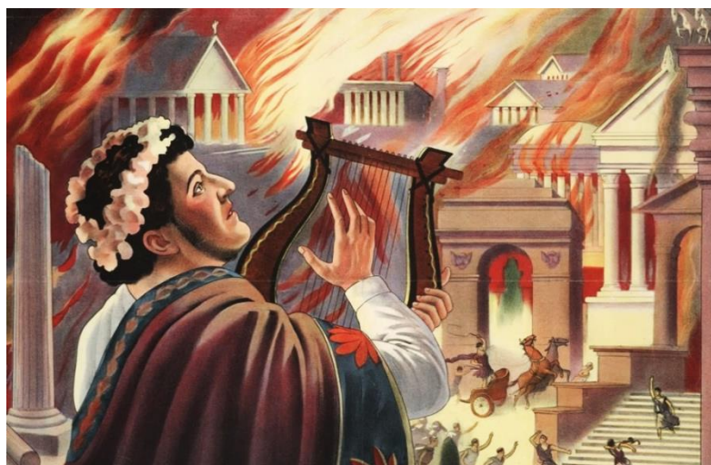
Нерон, император, правивший Древним Римом с 54 по 68 год от Рождества Христова.

Царь Нерон, узнав о позорной кончине своего друга, чрезвычайно разгневался на святого Петра и хотел его убить. По смерти Симона волхва святой Пётр пробыл в Риме недолго; обратив многих и крестив, утвердив церковь и поставив епископом Лина, он пошёл из Рима в Тарракину. В Британии