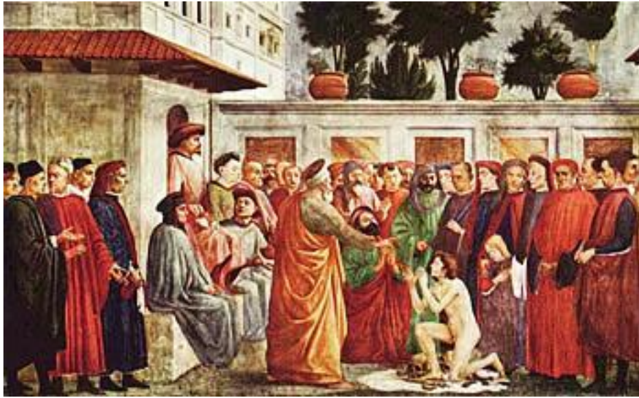
«Воскрешение усопшего апостолом Петром»