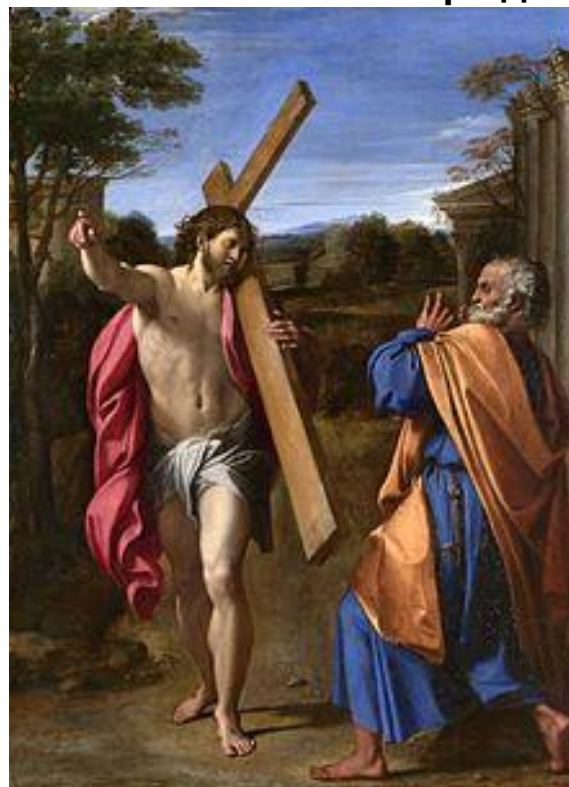
Domine, quo vadis?* , Аннибале Карраччи, XVII в. *старо-слав.: Камо грядеши, рус.: Куда идёшь, Господи?

Ещё больше интересных статей см. на сайте: https://небесный-дом.рф