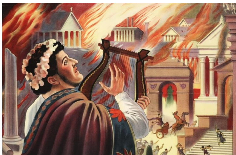
Нерон, император, правивший Древним Римом с 54 по 68 год от Рождества Христова.

Царь Нерон, узнав о позорной кончине своего друга, чрезвычайно разгневался на святого Петра и хотел его убить. По смерти Симона волхва святой Пётр пробыл в Риме недолго; обратив многих и крестив, утвердив церковь и поставив епископом Лина, он пошёл из Рима в Тарракину. В Британии