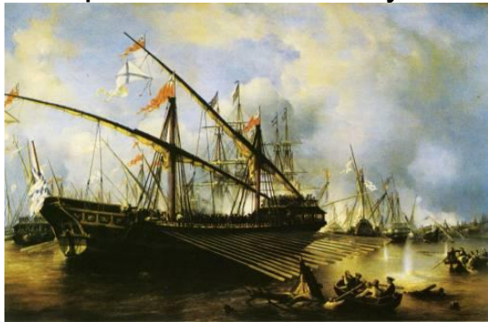
Сражение между шведским и русским флотами в Балтийском море около острова Гренгам - последнее крупное сражение Северной войны. Конец безраздельного шведского влияния на Балтийском море.

Память святого Пантелеимона издревле чтится Православным Востоком. Почитание святого мученика в Русской Православной Церкви известно с XII века. Великий князь Изяслав, в святом Крещении Пантелеимон, имел изображение великомученика на своем боевом шлеме и его заступничеством