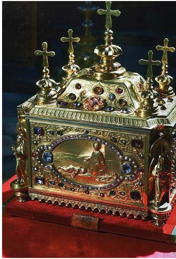
Ковчег с цельбоносной главой вмч. Пантелеимона

Максимиан уговаривал святого опровергнуть донос и принести жертву идолам, но избранный страстотерпец Христов и благодатный врач исповедал себя христианином и на глазах императора исцелил расслабленного: «Во имя Господа Иисуса Христа, встань и будь здоров» , — произнес святой Пантолеон, и больной тотчас выздоровел. Ожесточенный Максимиан приказал казнить исцеленного, а святого Пантолеона предал жесточайшим мукам. «Господи Иисусе Христе! Предстани мне в эту минуту, дай мне терпение, чтобы я до конца мог вынести мучение!» — молился святой и услышал голос: «Не бойся, Я с тобой» . Господь явился ему «во образе пресвитера Ермолая» и укрепил перед страданиями. Великомученика Пантолеона повесили на дереве и рвали тело железными крюками, обжигали свечами, растягивали на колесе, бросали в кипящее олово, ввергали в море с камнем на шее. Однако во всех