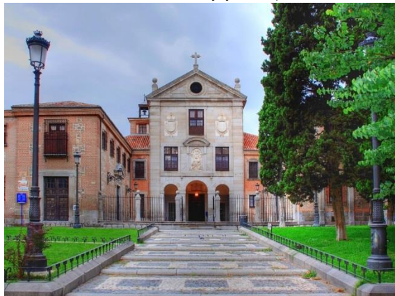
Монастырь Энкарнасьон в Мадриде

Кровь, которая пребывает в твердом состоянии в течение всего года, становится жидкой, без всякого вмешательства человека. Это чудо в Мадриде происходит накануне дня памяти мученической кончины святого, 26 июля (по Григорианскому календарю).