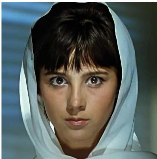
Наталья Варлей. Кадр из фильма «Кавказская пленница»