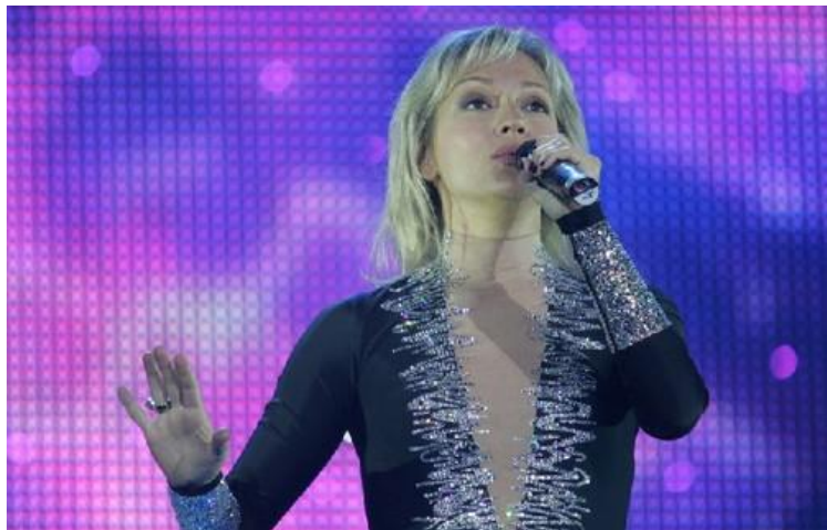
Татьяна Буланова - на сцене

Татьяна Буланова рассказала о своей жизни, сыновьях, вере, надежде, любви и дала универсальный совет на все случаи жизни