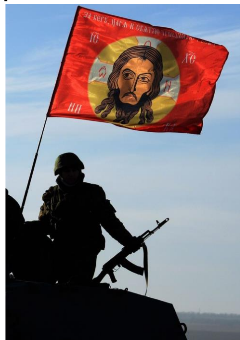
На Руси изображение «Спаса Нерукотворного» часто помещали над воротами крепостей и воинских стягах.