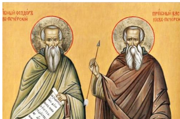
Преподобномученики Василий и Федор Печерские

Затем, чтобы не пребывать в праздности, преподобный Феодор возложил на себя великий труд: он поставил в своей пещере жернова и начал работать на братию, причём не только сам молот жито, но сам и приносил его из