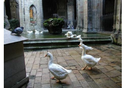
Внутренний дворик в кафедральном соборе с белыми гусями, посвящёнными мученице.