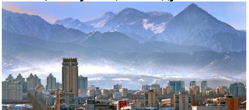
Современный город Алматы

“Господи, – подумала я, – если бы хоть одна капелька попала мне в глаза, ко мне вернулось бы зрение!” Вдруг в этот момент владыка повернулся в мою сторону и окропил мое лицо так, что святая вода вернулось зрение и я стала видеть так же хорошо, как видела прежде».