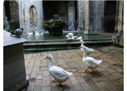
Внутренний дворик в кафедральном соборе с белыми гусями, посвящёнными мученице.

В это время в лагере исламистов буквально разразилась паника. Они утратили оба взрывных устройства, предназначенных для взрывов в соборах Барселоны, а их главный подрывник и лидер группы погибли. План по показательным взрывам в Барселоне таинственным образом «на корню» пресекся. Сами члены исламистской ячейки, захваченные живыми, признались в том, что они руководствовались в своих действиях именно религиозно-мистическими мотивами, и что обстоятельства такого же мистического свойства, но совершенно иного направления привели к тому, что их план по взрыву соборов Барселоны неожиданно потерпел крах, и они от отчаяния совершили «просто» автомобильные наезды на мирно гулявших жителей и гостей Барселоны. Много жертв и пострадавших, но их могло бы быть в десятки раз больше, осуществи террористы свой изначальный план. Поэтому верующие испанцы считают, что Господь Иисус Христос, Его Святое Семейство и святая Эулалия Барселонская сохранили Каталонию от ужасных ударов исламистов. Источники: 1) Жития святых Димитрия Ростовского (в сокращении): https://azbyka.ru/otechnik/Dmitrij_Rostovskij/zhitija-svjatykh/691 2) https://pravoslavie.ru/106116.html , 3) https://pravoslavie.ru/55884.html