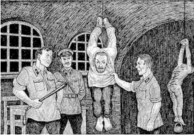
В камере пыток.

Обычно на следующий день заключённые в такой камере начинали