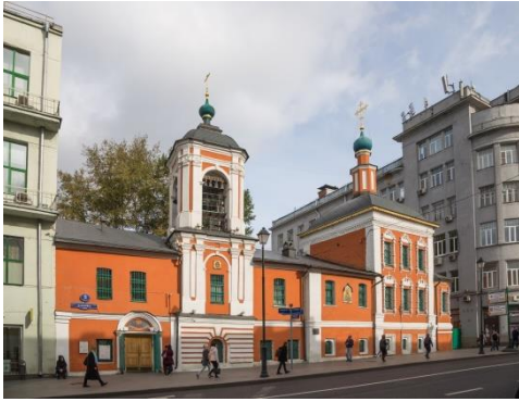
Храм святителя Николая в Кленниках,

В другой раз к старцу пришли две незнакомые ему прежде девушки просить благословение стать монахинями. Одну из них он охотно благословил, а другой велел вернуться домой. Девушка очень огорчилась. Окружающие стали расспрашивать её, и оказалось, что она живет с престарелой матерью, которая болеет и не желает слышать об уходе дочери в монастырь.