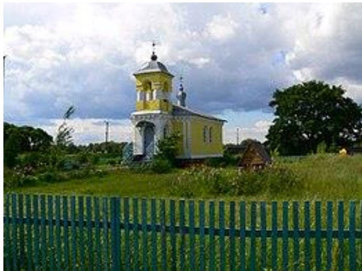
Часовня на месте Савво-Вишерского монастыря.