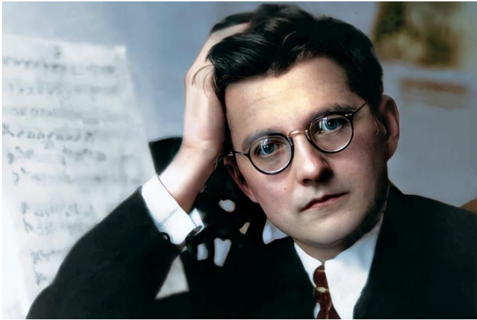
Великий композитор Дмитрий Дмитриевич Шостакович.