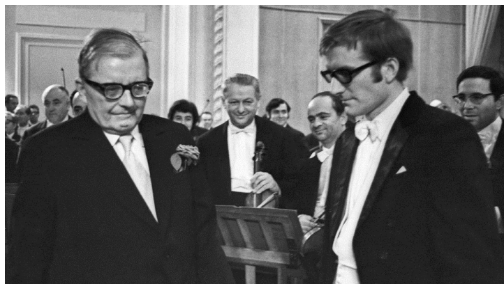
Максим Шостакович (справа) с отцом, Дмитрием Дмитриевичем Шостаковичем.