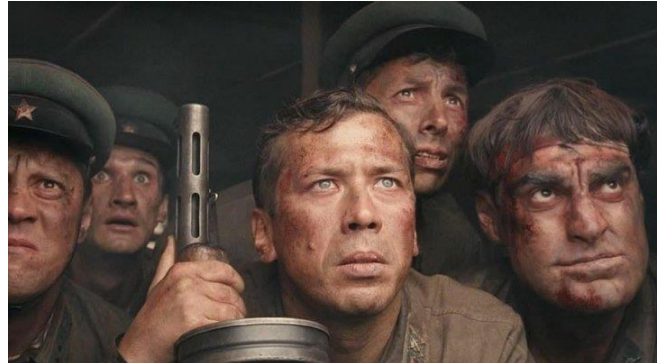
Кадр из фильма «Брестская крепость».

Ещё больше интересных статей см. на сайте: https://небесный-дом.рф