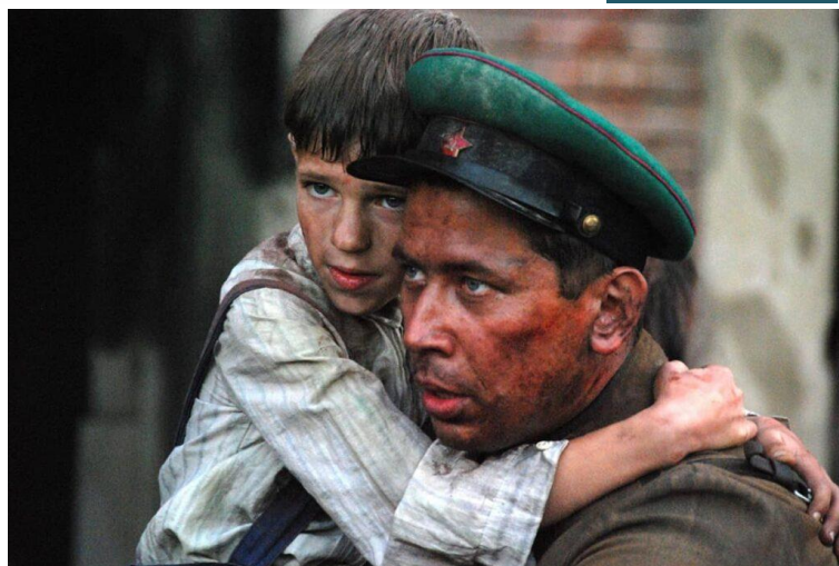
Кадр из фильма «Брестская крепость».

– Это даже не кажется насилием, родители чувствуют себя вполне прекрасно, им кажется, что они очень благие. Но только эта благость сталкивается с чудовищным антагонизмом потом, в подростковом