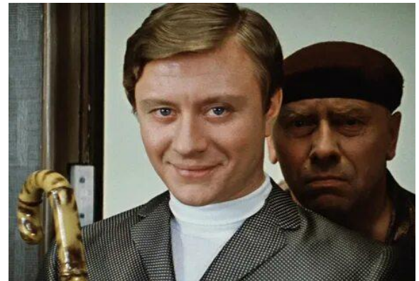
Андрей Миронов и Анатолий Папанов - в фильме «Бриллиантовая рука»