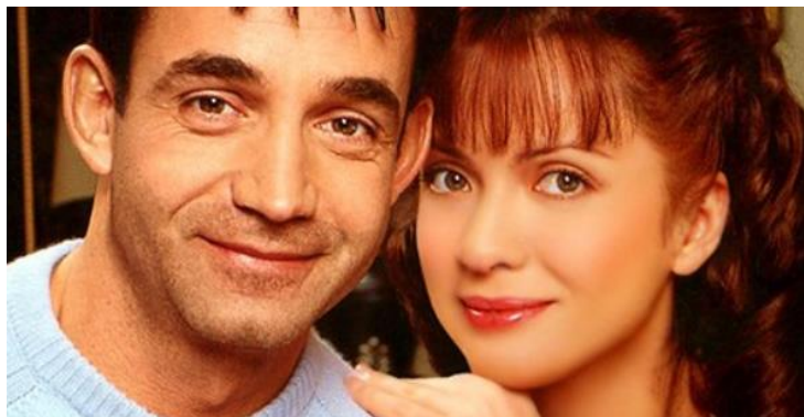
Дмитрий Певцов - с супругой актрисой Ольгой Дроздовой.