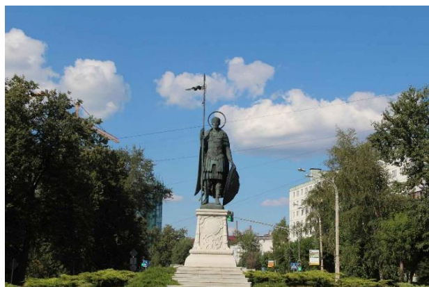
В 2008 году в г. Дмитрове (Московской области) открыт памятник святому великомученику Димитрию Солунскому — небесному покровителю города

Сербы и болгары с древнейших времен почитают великомученика Димитрия как покровителя славян, называют «отечестволюбцем» славянских народов, связывая это со славянским происхождением святого, а в старинных русских сказаниях святой Димитрий предстает русским по происхождению.