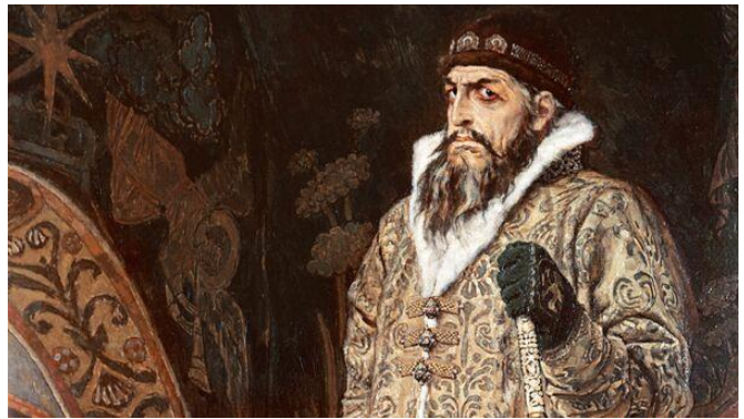
Царь Иоанн Грозный.

Ещё больше интересных статей см. на сайте: https://небесный-дом.рф (или: https://nebesniydom.ru ).