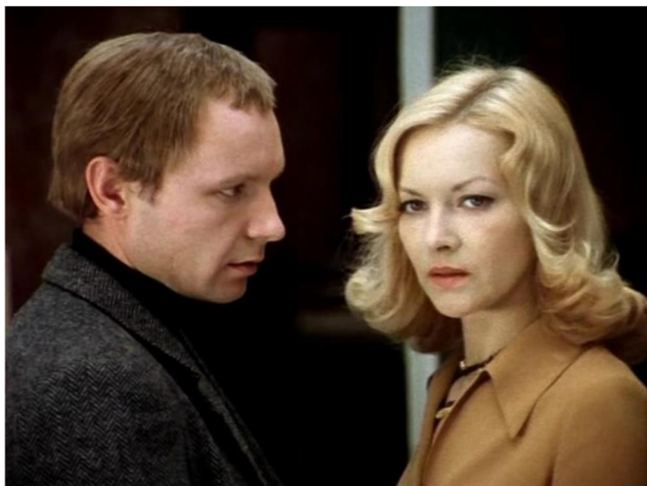
А.Мягков и Барбара Брыльска – в фильме «Ирония судьбы или с лёгким паром»

Конечно, Андрей Мягков навсегда вошёл в историю кино ролями двух милых (под стать фамилии актёра) людей среднего возраста: Лукашина в «Иронии судьбы» и Новосельцева в «Служебном романе». Однако если чуть-чуть отодвинуть этих всеобщих любимцев в сторону, обнаружится огромная фильмография и список спектаклей, в которых Андрей Васильевич блестяще играл самые неожиданные роли. И во время работы над которыми происходило