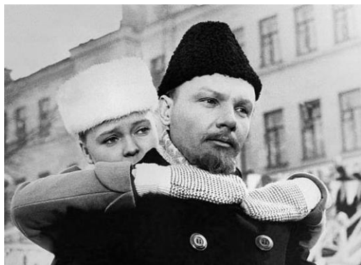
Андрей Мягков сыграл Ильича в фильме «Надежда»

Ещё до «Иронии судьбы...» Мягков играл Ленина в фильме «Надежда». Его режиссер, Марк Донской, под конец жизни создал свою маленькую лениниану – снял два фильма про мать будущего вождя, Марию Ульянову, и один фильм – про юность его жены, Надежды Константиновны. Вот как раз в образе 23-летнего жениха Надежды и предстал Мягков.