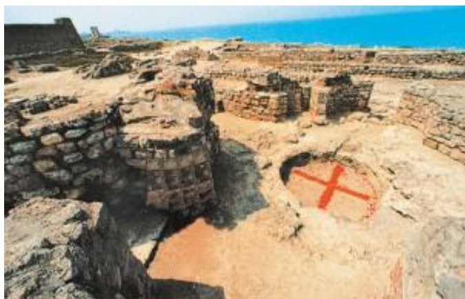
Купель баптистерия, где принял крещение князь Владимир. Раскопки в Херсонесе (Корсунь)

святого. Кирилл и Мефодий ночью с факелами шли к морю, плыли на лодке, долго молились – и вдруг открылись мощи Климента, было сияние, все косточки священномученика светились, «словно бисер», – так описывается это в известных сказаниях. Обретя мощи, Кирилл и Мефодий положили их в церкви Херсонеса. Кирилл считал, что сщмч. Климент покровительствует его миссионерской деятельности и делу просвещения славянских народов. Как показало время, это действительно было так. Когда через несколько лет братья принесли к папскому престолу переведенные на славянский язык и написанные славянскими письменами богослужебные книги, навстречу им вышел сам папа Адриан, узнав о том, что они принесли в Рим мощи их святого соотечественника — апостола Климента. Во многом благодаря принесенным мощам, миссия моравских братьев закончилась удачно: славянские книги были освящены папой, и в святом городе впервые на богослужении наряду с латынью зазвучала славянская молитва. Это было равносильно чуду! В Западной церкви в ту пору была распространена так называемая «трехъязычная» ересь, когда только три языка считались богослужебными: древнееврейский, греческий и латынь. Кирилл, придя в Рим, постригся в монахи (именно тогда приняв имя Кирилл вместо Константина), и вскоре отошёл ко Господу. Памятуя о заслугах просветителя перед престолом Св. Петра, его по настоянию папы Адриана хоронят в церкви Св. Климента.