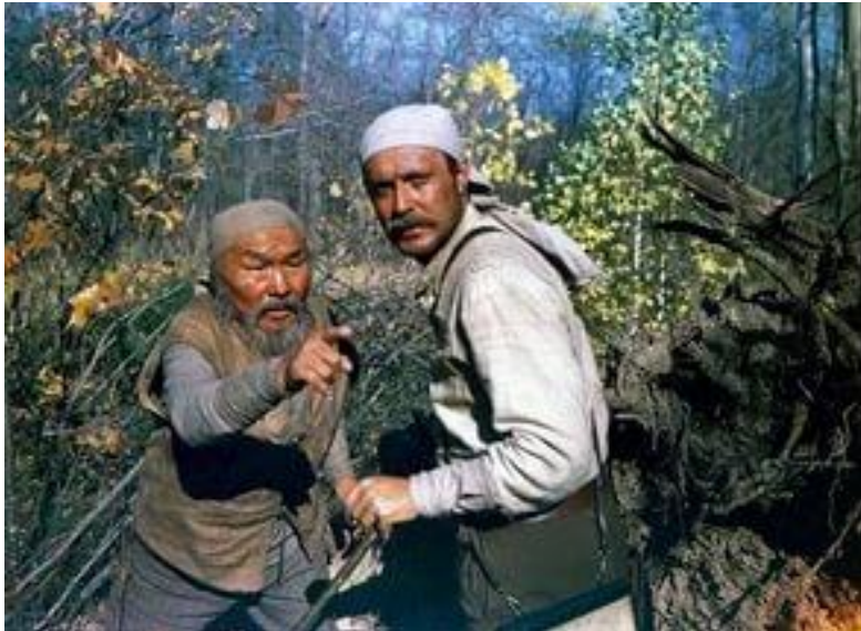
«Дерсу Узала» (1975). режиссёр Акира Куросава. Премия «Оскар» (1976).

- А себя вы считаете воцерковленным человеком?