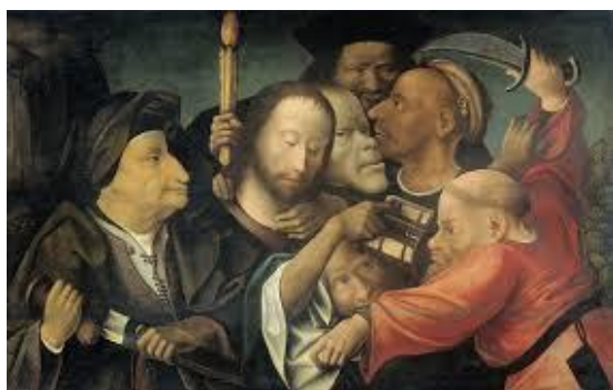
Иероним Босх. Арест Христа

Комната, где находились эти люди, была без окон и освещалась только керосиновой лампой, так что я не сразу смогла их рассмотреть, а когда посмотрела внимательно, не могла понять: не то женщины, не то мужчины; мрачны были их лица, какие-то горбоносые. Лица некоторых походили на головы хищных птиц с клювами, со злым выражением, с опущенными глазами – и показалось мне, что их ресницы и брови как бы