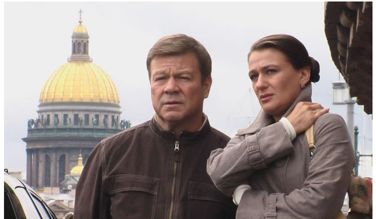
Кадр из фильма «Улицы разбитых фонарей»