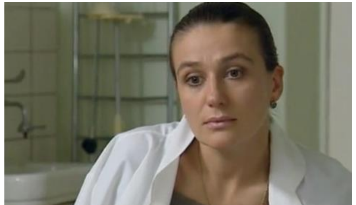
Кадр из фильма «Улицы разбитых фонарей»

— Конечно, семья! Никто никогда не говорил нам, как надо жить. Просто родители относились ко всему — к своим пациентам, к детям, к дому, к городу, к России — с какой-то невероятно ответственной любовью. Помню, как папа — хирург с мировым именем, просыпаясь, еще не открыв глаза, уже тянулся в поисках телефонной трубки, чтобы звонить и спрашивать, как его пациенты пережили ночь, хотя уже через час был в клинике. Когда мы ездили летом отдыхать в Сухуми, я не помню ни одного дня, чтобы папа не работал. Обычно его звали или оперировать, или консультировать. А когда он оставался с нами, папочка сидел в тени и писал научные труды, правил диссертации учеников. Он был человеком, который всё время созидал. Иногда к нему обращались за помощью люди, ещё недавно считавшие себя его врагами. Папа не только никогда не отказывал тем, кто делал ему гадости, но ещё и переживал за них — каково же им обращаться к нему, пытался деликатно и дружелюбно сглаживать такую неловкость! Вот глядя на это, мы не нуждались в объяснениях, что такое доброта, нравственность, честность и порядочность.