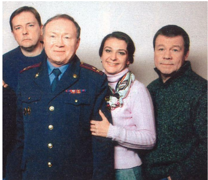
Герои телесериала «Улицы разбитых фонарей»

Помню, как встретила нашего отца Владимира в троллейбусе. Мне было лет тринадцать. Он спросил, куда я еду. Ответила, что в церковь. Батюшка обрадовался, говорит: «Так, выходит, я - не за всех вас. Ты, значит, сама - за себя?!» Очень он о нас всех молился и любил. И я его каждый день поминаю в утренних молитвах. С той встречи я всё хотела пойти на Исповедь, но никак не могла. Подходила, смотрела и уходила. Знала, что на Руси за то, что человек два года не был у Причастия, отлучали от Церкви. Переживала страшно, но дальше - ни в какую. И так у меня было до 30 лет.