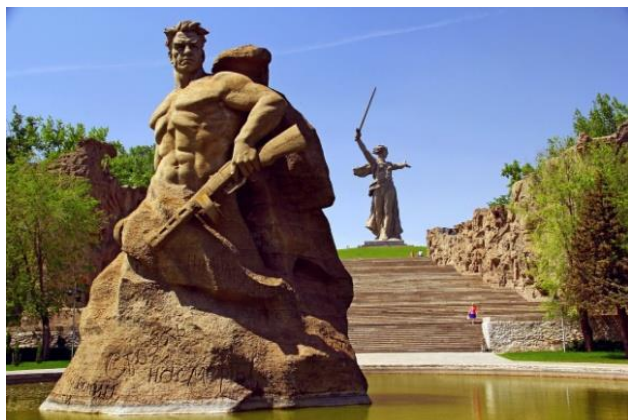
Мамаев Курган. Волгоград

P.S. Именем маршала В.Чуйкова названы улицы городов России, Казахстана, Украины, Белоруссии: Москвы, Волгограда, Казани, Челябинска, Уральска, Запорожья, Николаева, Горловки (Донецкая область) и др. В честь него названы Военный институт ракетных войск и ряд школ. О нём сняты художественные и документальные фильмы.