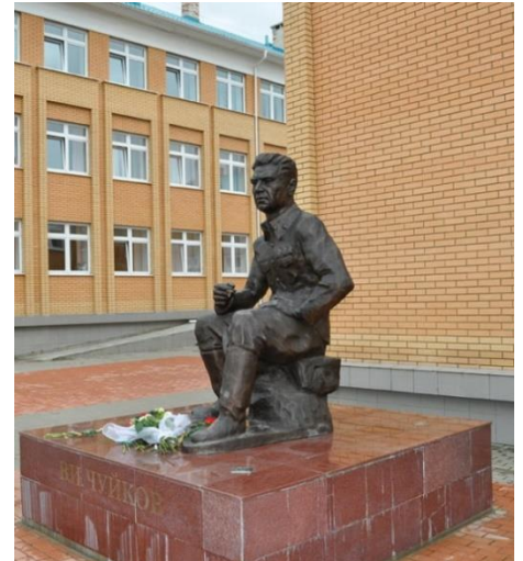
Фото: Памятник Василию Чуйкову в подмосковном райцентре Серебряные пруды, в котором маршал 12 февраля 1900 г. родился.

- как решето. А на мне - ни царапины! И я понимаю, что меня Бог спас. Хочу перекреститься, а руки от напряжения судорогой сведены - не могу разжать кулак. Пытаюсь пальцы сложить в крестное знамение -