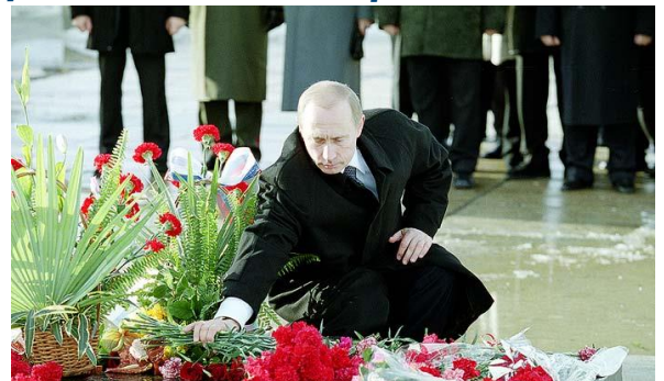
Цветы на могилу маршала В.Чуйкова возлагает президент В.Путин.

написал Чуйков жене 10 мая 1945 года. И была, наверное, какая-то высшая закономерность и справедливость, что именно легендарный командарм, мужественно сражавшийся со своими гвардейцами в Сталинграде, первым услышал это слово - «капитуляция». Была ведь потом официальная капитуляция в Карлсборге. А была другая, в ночь на 1 мая в центре вражеской столицы, когда высокомерный и беспощадный противник пришёл, склонил голову и сказал: «СДАЮСЬ НА МИЛОСТЬ!» . Принимал эту капитуляцию генерал Чуйков. Парад Победы. Банкет. Сталин трижды