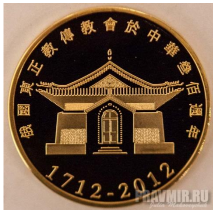
Памятная монета «Триста лет Российской Духовной Миссии в Китае. 1712-2012»