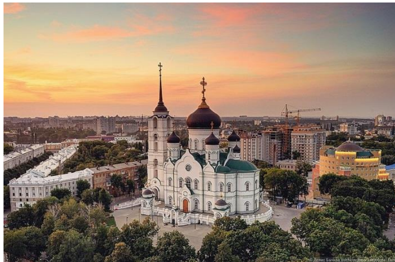
Благовещенский кафедральный собор

только как Покровительницу русских воинов, но и как Помощницу матерей. Верующие молятся перед иконой за матерей во время их чревоношения и родов - "дарует бо Богородица верным обильные дары целебные от неистощаемого источника святых иконы Албазинския".