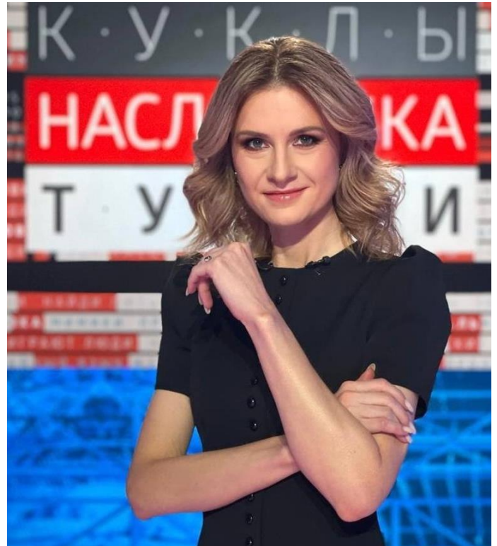
Фрагмент передачи 1-го канала ТВ «Куклы наследника Тутти»

- А он мне оставил (это, кстати, разрешалось, можно было передать через капеллана) малюсенький такой (у меня он до сих пор есть),