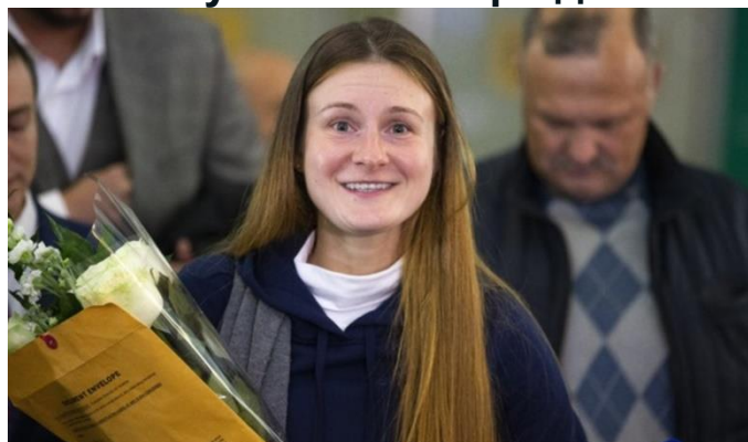
Возвращение на Родину после тюремного заключения в США.

- Не нужно. И в мире должен быть хотя бы один человек, которому ты доверяешь.