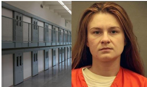
В американской тюрьме.

- То время, которое вы провели в тюрьме, привело, в плане отношения к вам окружающих, к предательству одних людей и к тому, что многие проявили вам верность. А скажите, пожалуйста, вот ваша вера в людей как-то изменилась после этого опыта, её стало больше, меньше, вы понимаете, что человек всегда может предать или вы, наоборот, понимаете, что есть люди, которые не предадут никогда? Как вы сейчас к этому относитесь?