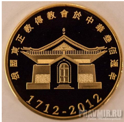
Памятная монета «Триста лет Российской Духовной Миссии в Китае. 1712-2012»

Но и после гибели Албазина Бог судил его жителям выполнить ещё одно служение на благо Церкви. Прекращение военных действий способствовало Божиим Промыслом усилению благодатного воздействия Православия на народы Дальнего Востока. За годы войны около сотни русских казаков и крестьян из Албазина и его окрестностей попали в плен и были отведены в Пекин. Богдыхан (император) приказал даже отдать одно из буддийских капищ для устройства в китайской столице православного храма во имя Софии, Премудрости Божией. В 1695 году митрополит Тобольский Игнатий отправил в Софийский храм антиминс, миро, богослужебные книги и церковные сосуда.