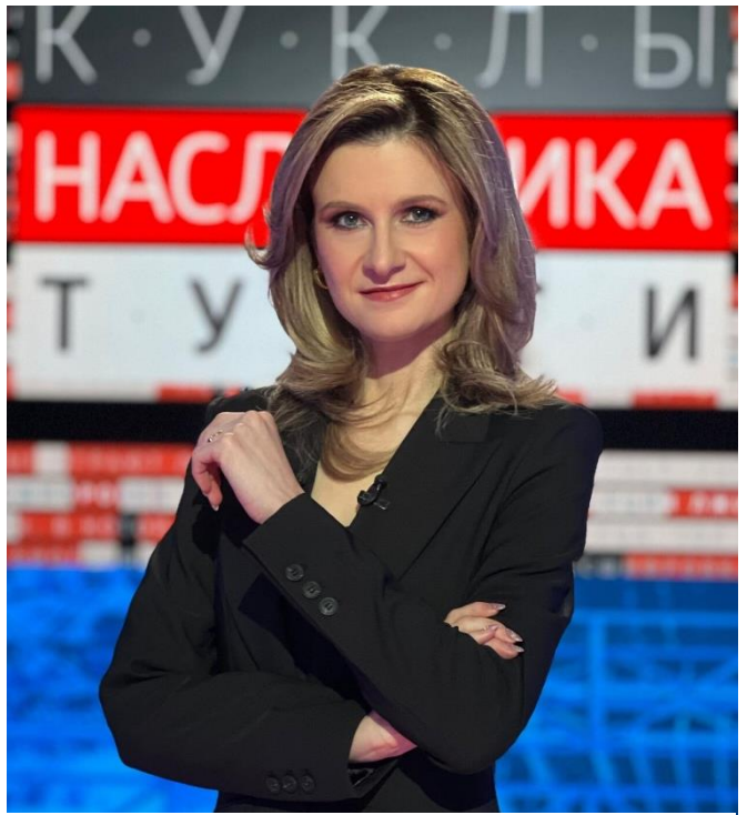
Фрагмент передачи 1 канала ТВ «Куклы наследника Тутти».

О приходе к вере в тюрьме и о критическом моменте. О плохих поступках Марии Бутиной в тюрьме. О семье Марии Бутиной — нынешней и будущей. И была ли Мария Бутина разведчицей? Об этом и многом другом